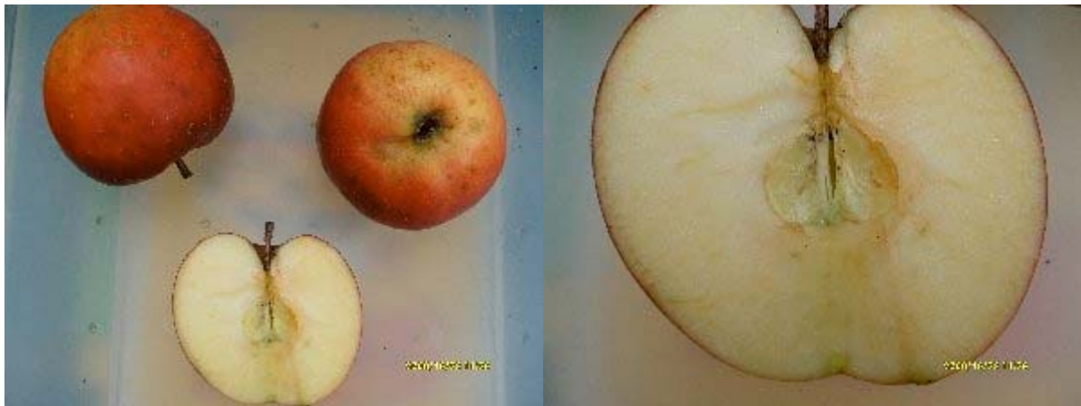
des pommes de Maurice TACHON de l'Allier. Merci à toi ami.(la chair est en réalité jaune. Ici le flash a faussé).

ORIGINE : Trouvée en Haute-Vienne et en Corrèze. On peut se demander si ce n'est pas un semis ou un clone de Winesap (voir cette fiche) introduite en France en 1872 depuis les USA par les pépinières Simon Louis de Metz.. J'ai trouvé la même pomme en 1979 dans le département de la Haute-Saône sous le même nom. Ne pas confondre avec Winter Banana dite Banane d'Hiver.