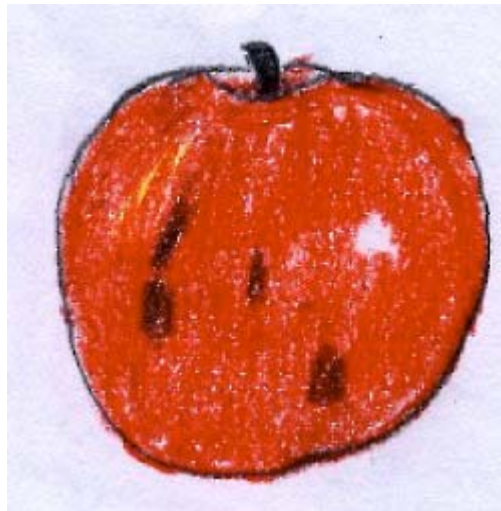
Croquis Choisel Jean-Louis.