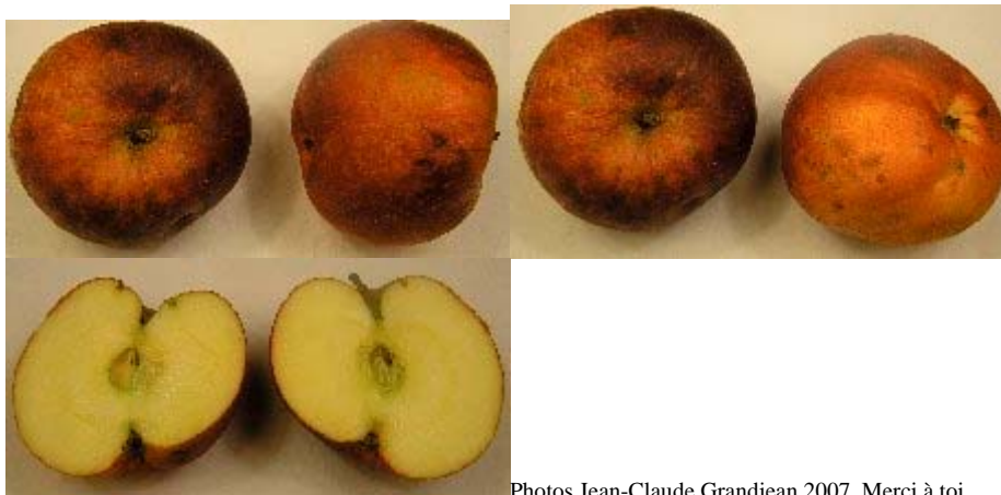
Merci à toi.